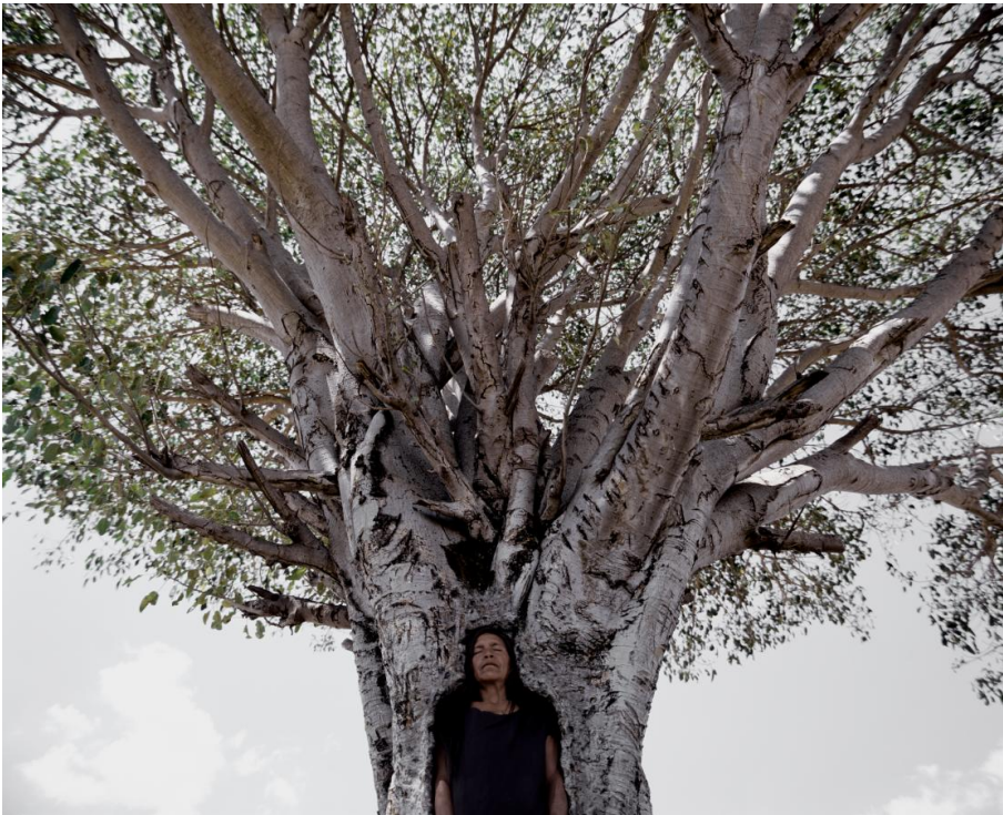
Photo: Shirin Neshat, Tooba, 2002, Production Still

Vendredi, 30 octobre 2015, Centre Paul Klee à Berne